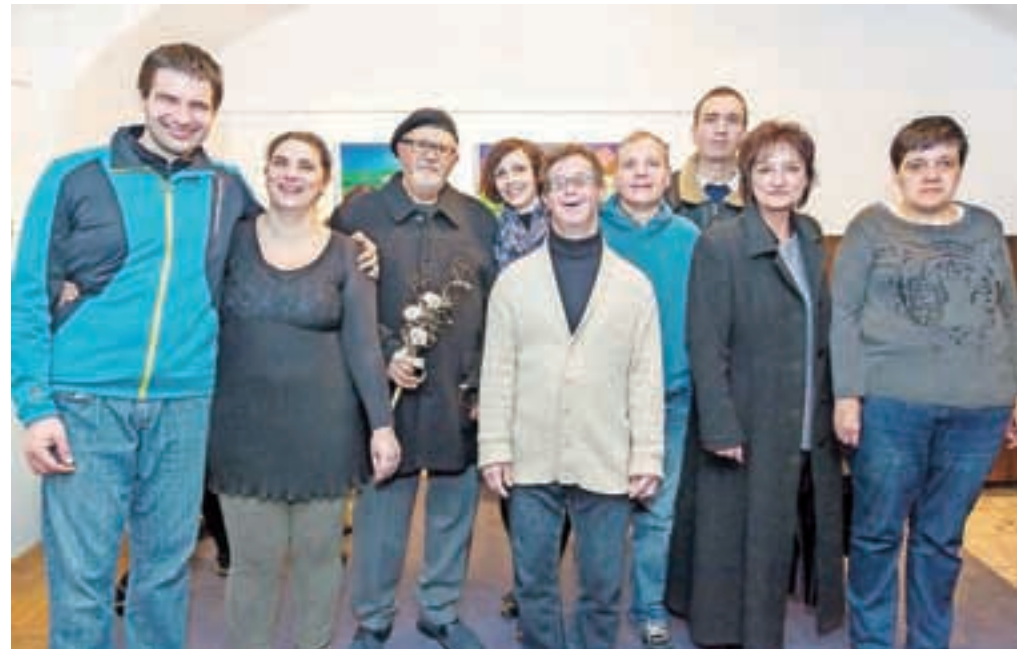
Prijatelji, sodelavci, ustvarjalci na razstavi, ki jo morate videti.