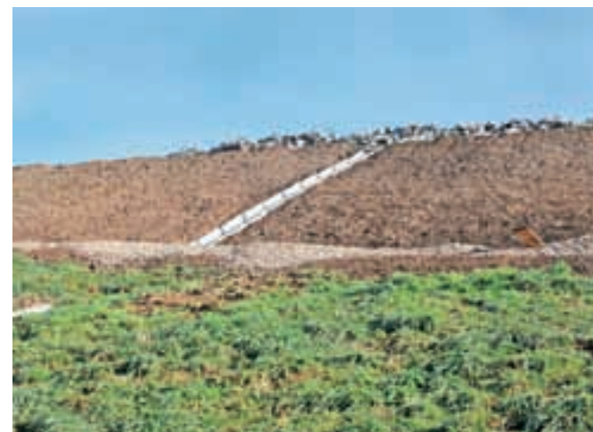
Sanacija deponije Kovor že poteka.

rekultivirali del zahodnega oboda odlagališča, v naslednjih dveh letih pa še preostanek oboda ter pokrov deponije. Na območju deponije bosta ostala zbirni center ter prekladalni plato za odpadke. Odpadke iz tržiške občine, ki so primerni za odlaganje na odlagališču za nenevarne odpadke, bodo po novem letu odlagali na Mali Mežaklji. V katerem centru bodo predhodno obdelovali mešane komunalne odpadke iz tržiške občine, pa v tem trenutku še ni znano oz. je odvisno od tega, ali bo Mala Mežaklja dobila dovoljenja tudi za delovanje centra za obdelavo odpadkov.