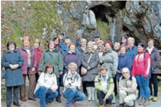
Izobraževalni izlet v Žalec konec novembra

Pri Ljudski univerzi Tržič potekajo številni zanimivi programi, dogodki, že po novem letu bodo imeli tečaj ambientalnega mozaika.