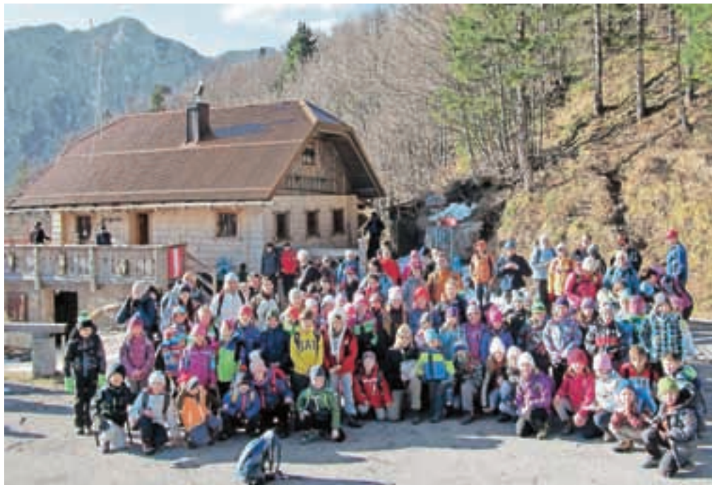
Pozdrav s starega Ljubelja

Tudi dvodnevni junijski tabor na Zelenici je bil nekaj posebnega. Na septembrski izlet po poti Triglavске Bistrice v dolino Vrat smo se odpeljali kar s tremi avtobusi. Oktobra smo se peš odpravili izpred podljubelske šole skozi Vasovje na Kal in po markirani stezi do Završnikovega roba in se po cesti vrnili pred šolo. Uživali smo v domačem kraju in v gostoljubju domačinov.