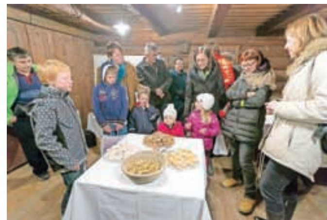
Razstavili so jedi, ki so jih včasih pripravljali za božič, nekatere izmed dobrot je bilo mogoče tudi pokusiti.

Tržič – Tržiški muzej je v minulih dneh prijazno povabil v Kurnikovo hišo, kjer je bila na ogled razstava Jedli smo skromno, a bilo je praznično. Predstavili so praznovanja in šege, značilne za adventni čas, jaslice, Miklavževanje, nošenje Marije, božič, pisanje voščilnic, okraševanje božičnega drevesa, polnočnico, blagosloavljanje in koledovanje. Razstavili so jedi, ki so jih včasih pripravljali za božič, nekatere izmed dobrot je bilo mogoče tudi pokusiti. Jedi so pripravile članice Podeželskih žena Svit.