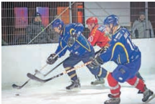
Tako je, ko se pomerijo profesionalci...