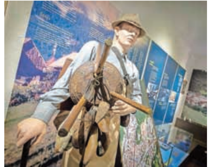
Le čevlje sodi naj kopitar; Ta veseli dan kulture v čast pesniku Prešernu