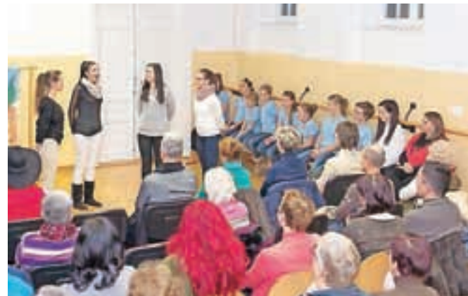
Raziskavo Pevska kultura Tržičanov so predstavili konec novembra na Balosu.

Z raziskavo smo pridobili kar nekaj gradiva za nadaljnje poustvarjanje pevske kulture Tržičanov, pridobljeno znanje pa želimo širiti in ga predati občanom, ki jim pesemska dediščina nekaj pomeni. Le tako se bo ohranila in živela med ljudmi.