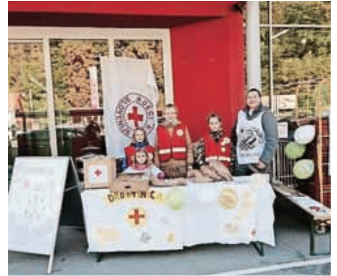
Ob svetovnem dnevu hrane so organizirali humanitarno akcijo Drobttinica.

Izpeljali so akcijo Drobttinica ob svetovnem dnevu hrane, s katero so zbrali dobrih devetsto evrov, denar pa razdelili med tržiške osnovne šole za njihove učence. »Desetim osebam in družinam smo pomagali s plačilom položnic, 1482 evrov pa smo podarili za pogorelo domačijo. Omogočili smo letovanje nekaj otrok in starejših na Debelem rtiču preko akcije Peljimo jih na